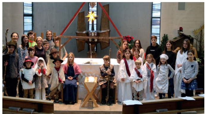
Krippenspiel in Immenstaad, Foto: Ch. Hepp

Durch die überraschende Schließung der Linzgauhalle in Immenstaad wegen Wasserschaden, stellte das Krippenspiel 2023 das Team vor eine große Herausforderung. Zum Glück konnten wir in der Kapelle des Hauses St. Vinenz Pallotti auf dem Hersberg feiern – allerdings ohne Bühne und mit sehr problematischer Akustik. Das Team stellte ein beeindruckendes Krippenspiel auf die Beine, das die Gottesdienstbesucher und den ganzen Raum einbezog.