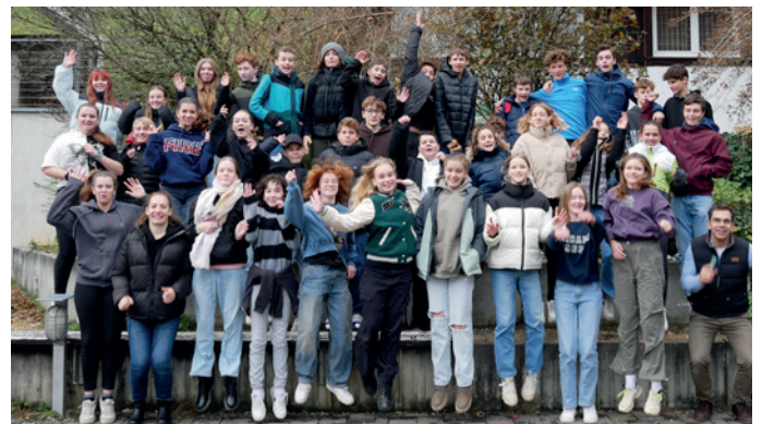
Die Markdorfer Konfisy