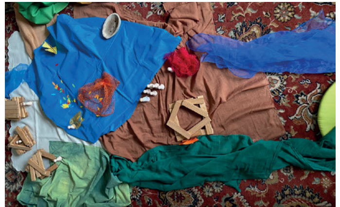
Von nun an sollt ihr Menschenfischer sein, Foto: I. Nützel

Mit diesem Thema beschäftigten sich die Schulkinder im Kindergottesdienst im Februar. Wer waren die Jünger Jesu und was zeichnet sie aus? Können wir auch Jüngerinnen und Jünger sein? Die Vorschulkinder haben währenddessen spielerisch „den Sturm gestillt“ und mit dieser Geschichte von Jesu Vollmacht und Fürsorge erfahren.