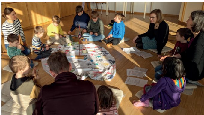
Kindergottesdienst in Markdorf, Foto: KiGo-Team

Im Januar ging es in unseren Kindergottesdiensten um Salomo. König Salomo wünscht sich nicht Reichtum oder ein langes Leben, sondern ein „hörendes Herz“. Also schenkt Gott ihm ein weises und verständiges Herz; so kann er seinem Volk ein guter König sein und gerechte Urteile fällen. Mit Bewegungen und Instrumenten haben wir die Bibelgeschichten über Salomo gemeinsam mit den Kindern erzählt und überlegt, wie man mit dem Herzen hören kann. Im Anschluss haben wir Herzen und bunte Rasseln gebastelt.