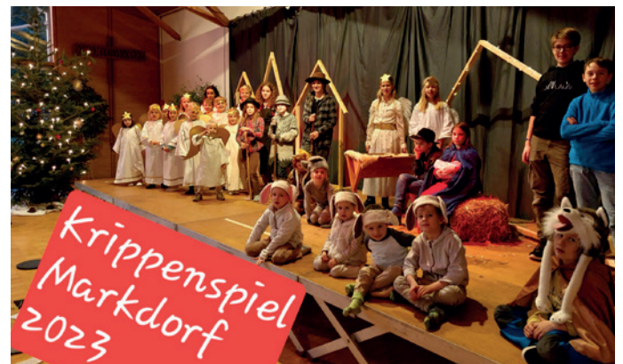
Krippenspiel in Markdorf

Alle Jahre wieder – beginnen im November schon die Proben fürs Krippenspiel. 30 Kinder und Jugendliche waren mit Feuer und Flamme dabei, auch dieses Mal auf besondere Weise von Jesu Geburt zu erzählen. Alle haben fleißig gearbeitet: es mussten Texte gelernt, an Szenen gefeilt, Kostüme angepasst, Bühnentechnik aufgebaut werden und wir haben sogar ein wundervolles neues Bühnenbild bekommen.