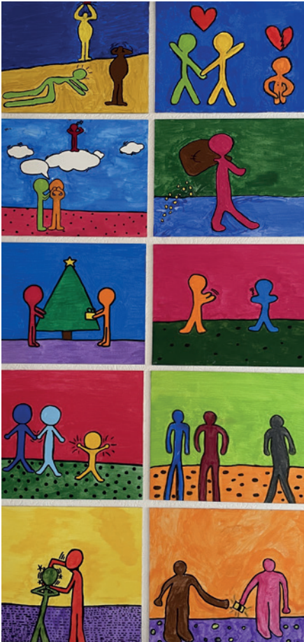
Die Zehn Gebote, Foto: A. Eckstein

Folgende Konfirmandinnen und Konfirmanden haben beschlossen, sich der Herausforderung als Christ*in zu leben, zu stellen und bekräftigen das mit ihrem „Ja“: