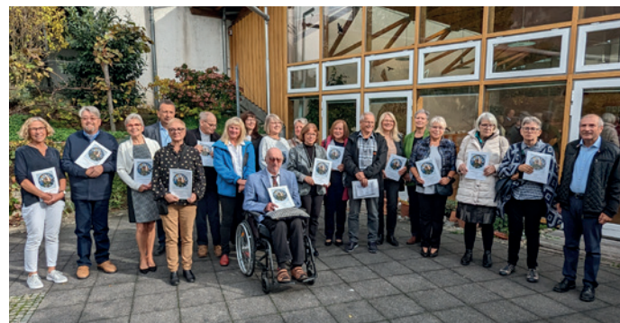
Die Jubelkonfirmandinnen und -konfirmanden 2023 in Markdorf