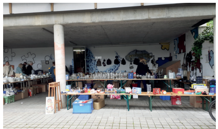
Der Flohmarkt des Förderkreises

Am Sonntag, den 5. Mai, steht nun wieder das Dixiefest in Markdorf an und damit auch unser Flohmarkt mit Kaffee und Kuchenverkauf.