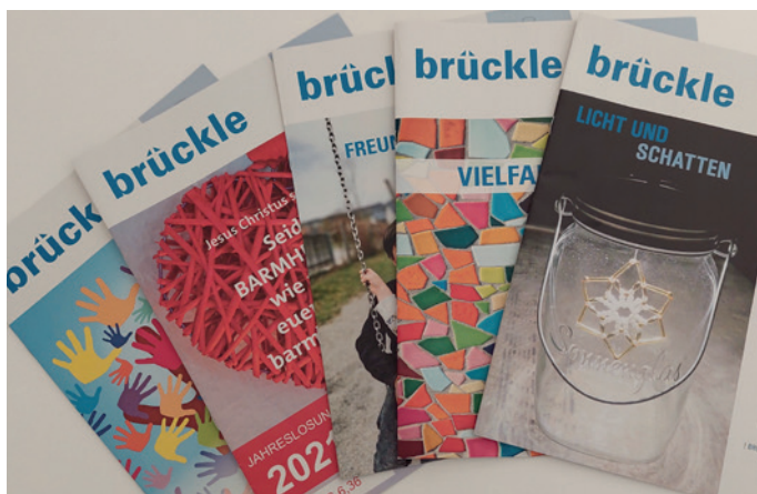
So bunt ist unser Brücke

Unser Redaktionsteam arbeitet gerne für das Erscheinen unseres Gemeindebriefs, denkt über aktuelle Themen nach, sammelt Informationen rund um das Gemeindeleben, bewirbt Veranstaltungen in unseren Kirchengemeinden. Ein großes DANKESCHÖN gilt unseren zahlreichen ehrenamtlichen Austrägerinnen und Austrägern, die in unseren Gemeinden unterwegs sind und das brücke zu unseren Gemeindegliedern bringen! Bei dieser wichtigen Aufgabe benötigen wir immer wieder Unterstützung. Wenn Sie die Möglichkeit haben, uns bei der Verteilung des brücke zu helfen, melden Sie sich gerne telefonisch oder per e-mail in den Pfarrämtern (Kontakt Daten siehe Einlegeblatt). Der Gemeindebrief berührt und verbindet Menschen in unseren Gemeinden. Er soll auch weiterhin gedruckt werden. Deshalb bitten wir um Ihre Spenden. In der Markdorfer Ausgabe unseres Gemeindebriefs finden Sie einen eingehafteten Überweisungsträger. Wir bedanken uns schon jetzt recht herzlich für Ihre Unterstützung!