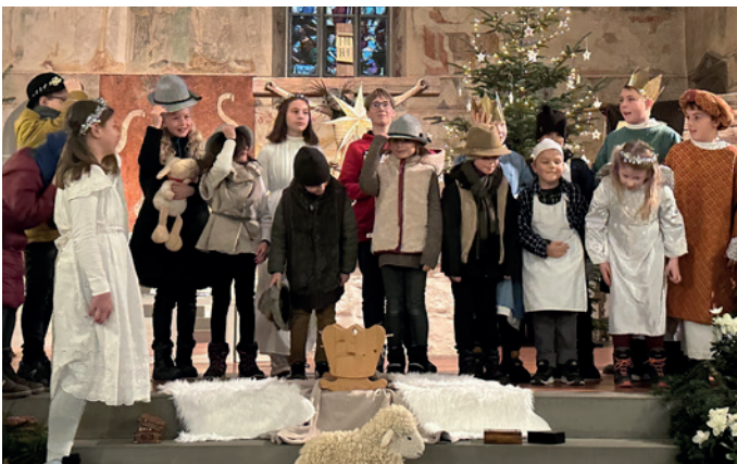
Krippenspiel in Bermatingen, Foto: S. Schauer

Der Weihnachtsstern strahlte im Gottesdienst in Bermatingen am Heiligen Abend 2023 ganz besonders hell! Er begleitete von Ferne Marias und Josefs Reise nach Bethlehem und ihre Suche nach einer Herberge. Er leuchtete auch für die Hirten auf dem Feld und selbstverständlich wies er den Heiligen drei Königen aus dem Morgenland den Weg zum Jesuskind in der Krippe. Unsere Sechzehn Schauspielerinnen und Schauspieler mussten dieses Mal sogar einen gereimten Text lernen. Alle verkörperten ihre Rollen sehr gekonnt!