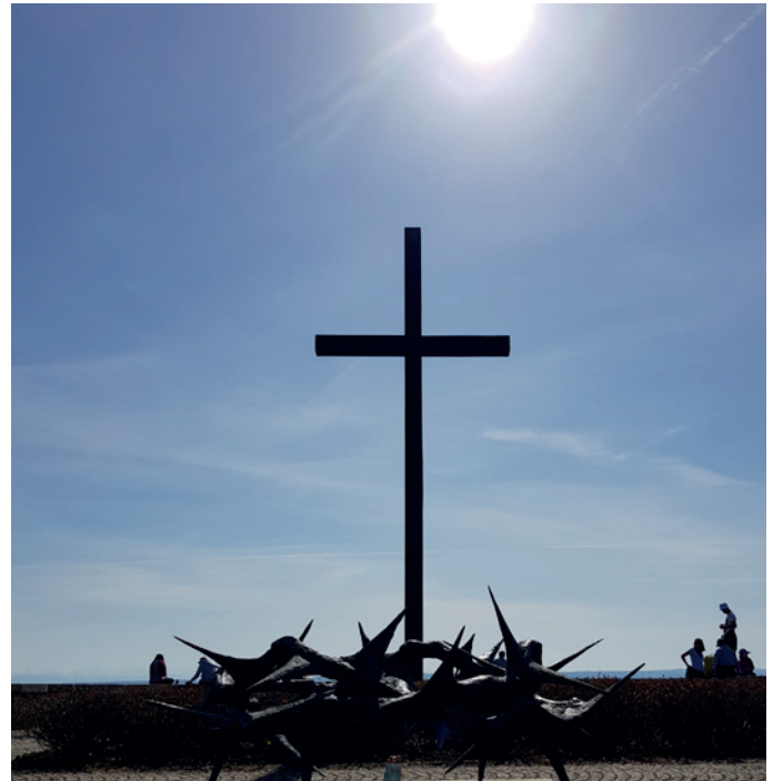
Das Kreuz in der Ostersonne

Danken ist gesund und kann gesund machen. Wissenschaftliche Studien haben die positive Wirkung des