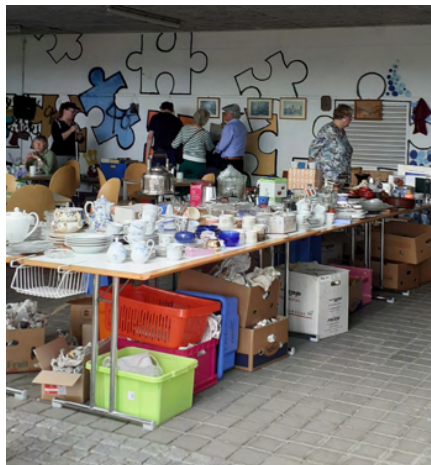
Unser Flohmarkt erfreute sich großer Beliebtheit!

Bei unserer Jahreshauptversammlung am 15. März waren 14 Mitglieder anwesend. Dabei wurde beschlossen, dass der Förderkreis die Bücherei mit 600€ zur Anschaffung von guten Kinderbüchern unterstützt. Gleichzeitig wurde ein Sonnenschutz in der Bücherei in Auftrag gegeben. Außerdem steht Geld bereit, um den Jugendraum für Jugendlichen einladender zu machen. Für die beiden Kantatengottesdienste im Herbst werden wir auch Geld zur Verfügung stellen.