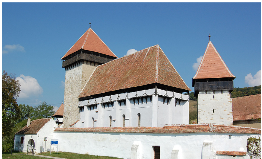
Probstdorfer Kirchenburg: über Jahrhunderte wurden hier jeden Sonntag Gottesdienste gefeiert; nun wird sie mehr und mehr zu einer touristischen Attraktion.