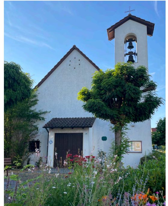
Evang. Kirche in Immenstaad

Wenn ich nun den Bogen schlage von der Stiftshütte und dem Vorhang vor dem Allerheiligsten bis zu unserer Kirche und unserer Art Gottesdienst zu feiern, so kann ich nur sagen: Das Himmelreich ist nah herbeigekommen.