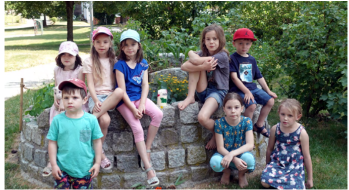
Das KiGo-Team Markdorf

dogs und viel Spaß mit einem Fallschirmtuch sowie einem Planschbecken beschließen.