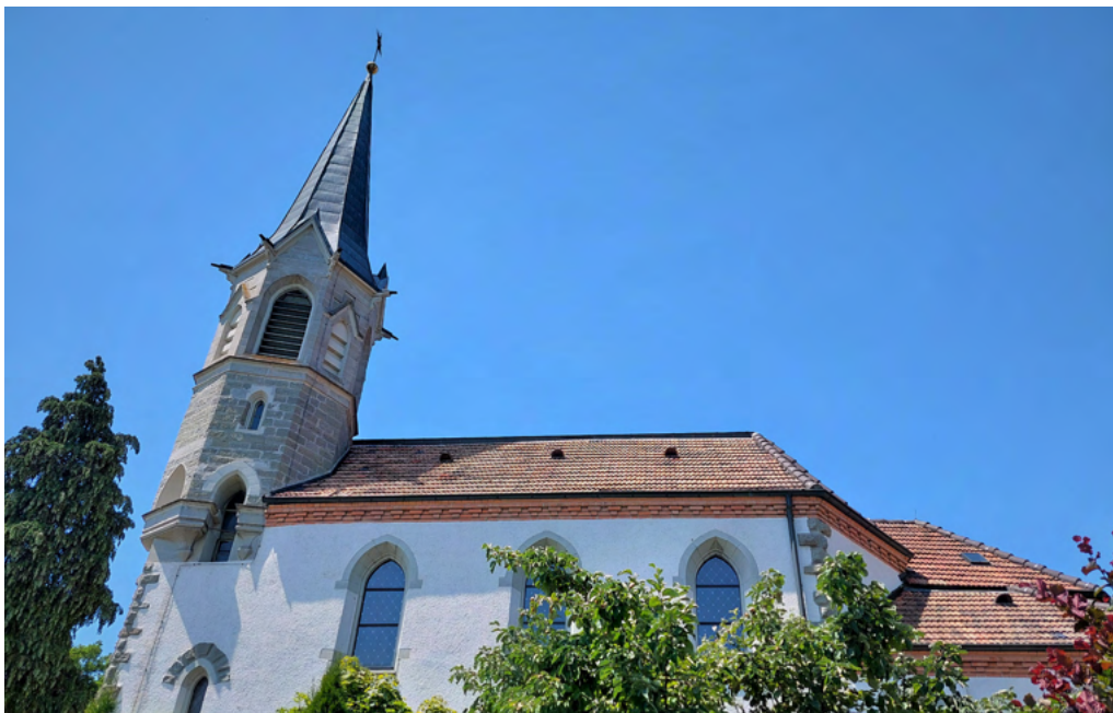
Die Evang. Kirche Markdorf ist 126 Jahre alt.

wissen, dass das Leben endlich ist. Wir alle spüren, dass das Leben doch mehr ist als Arbeit und Vergnügen. Wir alle ahnen, dass es Dimensionen des Lebens gibt, die wir mit unserem Verstand nur antippen, aber nicht vollauf begreifen können. Für dieses Wissen, Spüren und Ahnen gibt es Orte. Es sind die Kirchen! Und die Kirchen sind nichts Anderes als Gebetsräume, Kontaktstellen, die uns einen Raum eröffnen für all das, was unser Fassungsvermögen übersteigt und was doch spür- und erfahrbar ist.