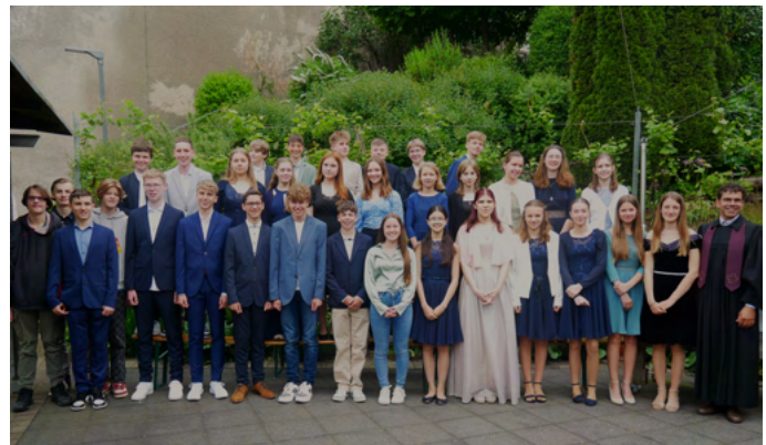
39 Jugendliche wurden im Mai 2023 in unserer Markdorfer Kirchengemeinde konfirmiert.

Aber auch die ganz normalen Mittwochstreffen sollen nicht unerwähnt bleiben, ebenso der Besuch bei der Tafel und engagierte Konfis im Gottesdienst oder als Helfende beim Kinderbibeltag. Die Konfis waren sichtbar in unserer Gemeinde! Manche von Ihnen haben sich schon als Teamer für das kommende Jahr angemeldet, viele werden hoffentlich auch weiter in unseren freitäglichen „Jugend-Chill-Abend“ kommen und manches mehr.