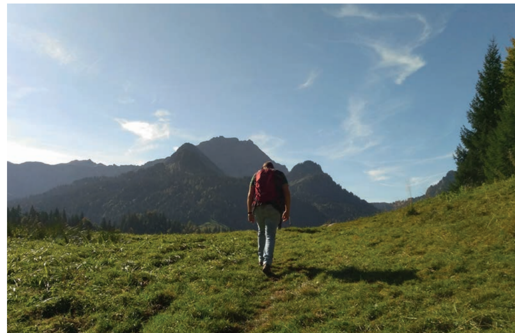
Genau wie im „richtigen Leben“: den Berg mühsam hinauf und hinunter wandern.

Krankheit, Unfall oder Gewalt und Gräueln. Und der Evangelist Matthäus fragt im Kapitel 6 in Vers 27: „Wer ist unter euch, der seines Lebens Länge eine Spanne zu setzen kann, wie sehr er sich auch darum sorgt?“ (Lutherübersetzung 1984). Die moderne Medizintechnik und die Pharmazie können schon Leben verlängern. Nur eben quantitativ aber nicht unbedingt qualitativ. Zu allen Zeiten haben Menschen gestöhnt: „Was ist das für eine Zeit“. Mal war sie gut, mal schlecht. Da eilen die Lebensjahre dahin, und allzu oft hört man die Klage, wo sie denn geblieben sind, die schönen Jahre. Wohl dem, dessen Rahmenbedingungen für sein Leben erträglich sind oder waren, also kein Krieg, keine Krankheit kein Seelenschmerz. Doch selbst wenn dieser Rahmen nicht ideal ist, steht einem erfüllten Leben nichts im Wege. Das Leben ist wie eine Bergbesteigung, die viel Kraft, Ausdauer und Puste bedarf, um auf dem Gipfel eine atemberaubende Aussicht zu genießen. Klingt das nicht so, wie im oben genannten Psalm? Einen großen Teil unseres Lebens verschlafen wir. Zusammengerechnet sind das Jahre. Und Jahre sind es auch, die wir im Büro, in der Werkstatt oder sonst wo beruflich oder zur Ausbildung verbringen. Und das soll uns auf die Lebenszeit angerechnet werden? Ganz abgesehen vom Putzen, Werkeln, Einkaufen und und ... Das ist aber nicht gerecht – oder doch?